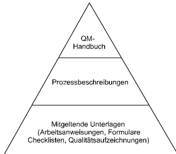
Bild 2: Schematischer Aufbau der Qualitätsmanagementdokumentation

Checklisten und Qualitätsaufzeichnungen. Die Gliederung des Qualitätsmanagementhandbuches orientiert sich in der Regel an den betrieblichen Prozessen. Der Aufbau der Qualitätsmanagementdokumentation soll anhand folgender Grafik (Bild 2) veranschaulicht werden: